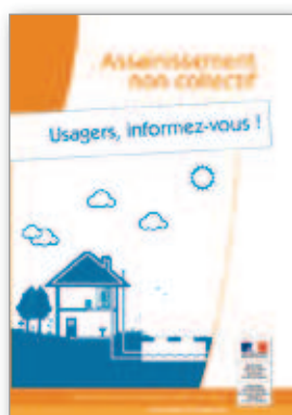
Assainissement non collectif Usagers, informez-vous ! 6 pages - octobre 2013