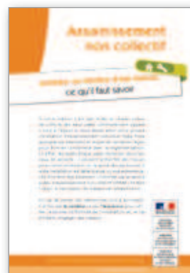
Assainissement non collectif Acheteurs ou vendeurs d'une maison, ce qu'il faut savoir 4 pages - octobre 2013