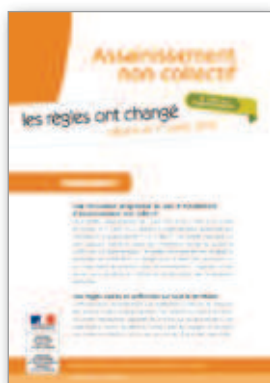
Assainissement non collectif Les règles ont changé depuis le 1 er juillet 2012 6 pages - octobre 2013